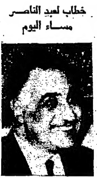
خطاب لعبد الناصر مساء اليوم

عبد السيد للثورة عمان - ١١ - يصرف اليوم جلالة الملك السيد الملك الحسين بن عبد الله الكبرى ، الأسرة الهاشمية الكبرى التي زاد في بهجتها الحق من الله بها على جلالة الملك وهو الأمير بان زرقها الأربعين زين وعقشة عشية استقبال مسوها العام الجديد من غيرها السيد الجديد .